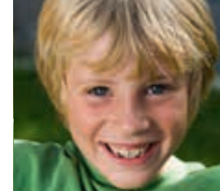
Omgangskretsen bør informeres når et barn har hodelus.