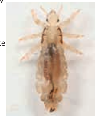
En voksen hodelus måler ca 3 mm.

Et lusetilfelle er sjelden isolert. Uten behandling kan familie og nære venner smitte hverandre gjentatte ganger.