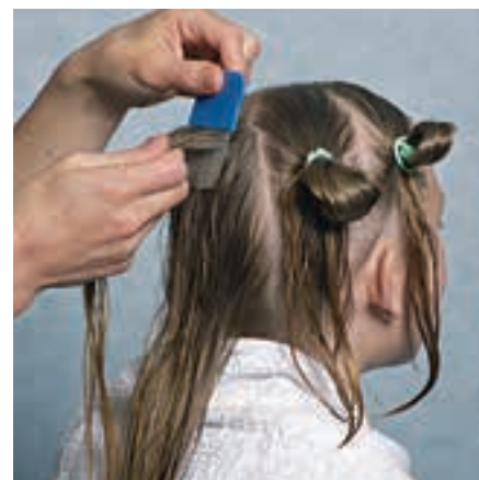
For å finne hodelus i langt hår er det lurt å dele håret i 3-6 hestehaler og gre én hestehale av gangen.

Følg bruksanvisningen på produktet nøye. Noen lusemidler skal ikke brukes av små barn eller gravide. Husk at bare den eller de som har lus skal behandles fordi det alltid er en liten fare for bivirkninger.