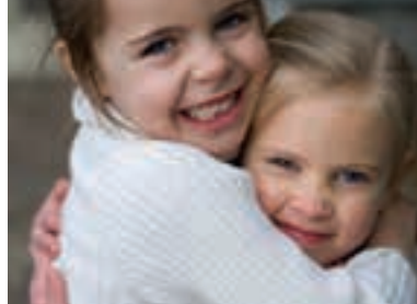
Hodelus kan verken hoppe eller fly, men kryper fra hode til hode ved nærkontakt.